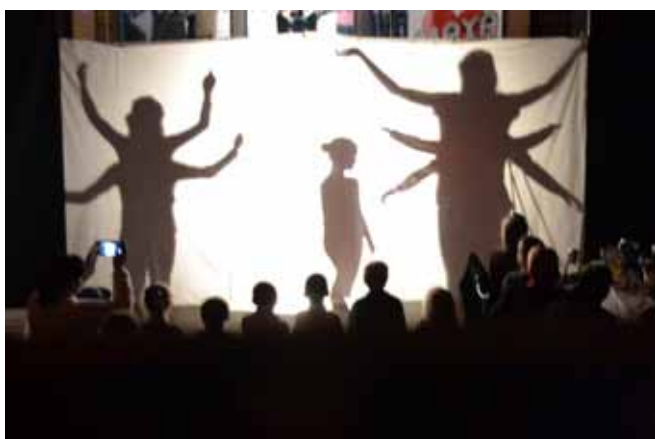
Stínohra „Tak jde život...“

A tak jen ve stručnosti: Fialkové plesání jsme připravovali s 26 dobrovolníky celý měsíc předem, již podruhé nám své krásné prostředí a zázemí zapůjčilo Divadlo Continuo ve Švestkovém Dvoře v Malovicích, a ač jsme si vše na ples navozili, vyzdobili do fialkových odstínů včetně výstavy obrazů našich uživatelů sociálně terapeutické dílny, mělo to své kouzlo již při vstupu návštěvníků. A že jich bylo zase víc než v loňském roce... dohromady nás bylo snad na tři sta.